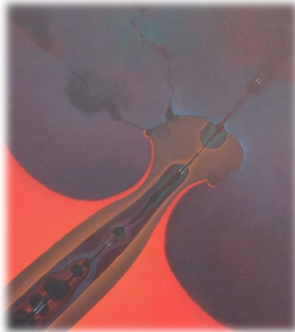
Terra, acqua e fuoco 2002