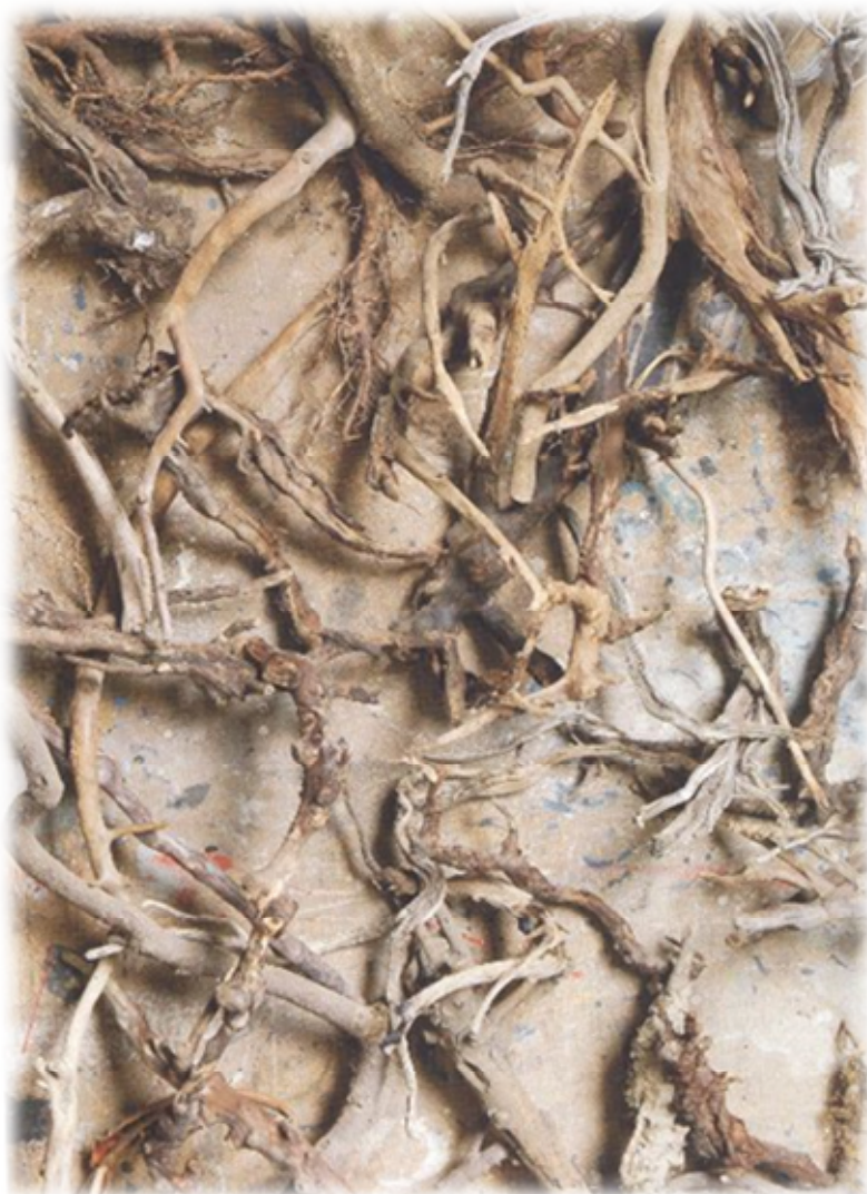
Particolari di radici