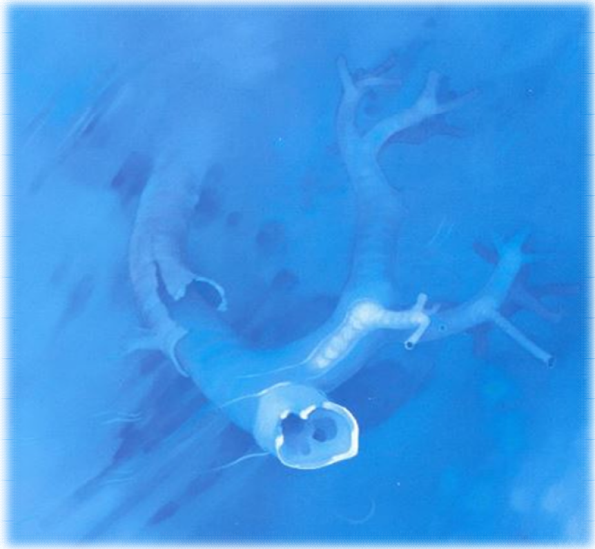
Albero sommerso 1979